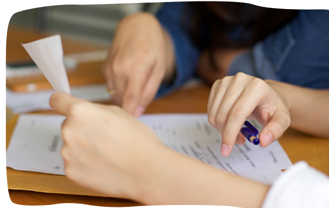
Wir unterstützen im Alltag.