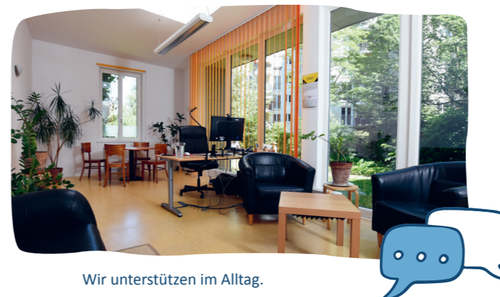
Wir unterstützen im Alltag.